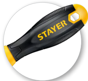
Эргономичная двухкомпонентная рукоятка