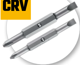
Биты из прочной Cr-V стали