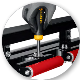
Торцовые головки 6 и 8 мм с глубиной вкручивания 50 мм