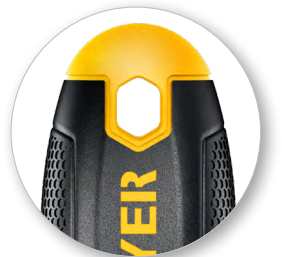
Отверстие в рукоятке для подвеса и хранения